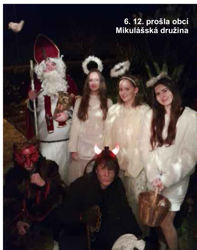
6. 12. prošla obcí Mikulášská družina