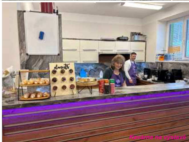
Kavárna na výstavě