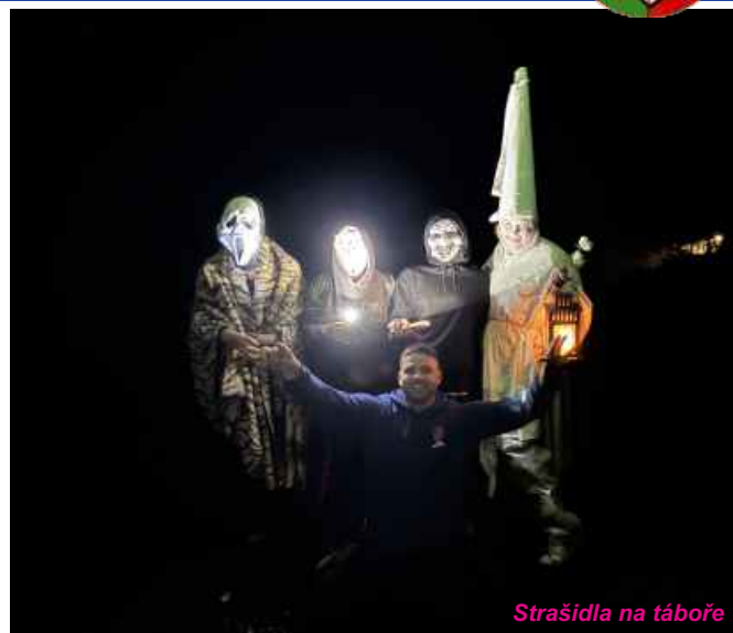
Strašidla na táboře

Měsíc duben vrcholí Velikonoční výstavou , kterou pořádáme